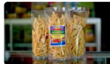
Stik Rumpit Laut Rp. 16.000 /pcs