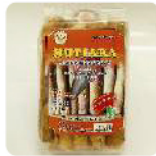
Astor Rp. 15.000 /100gr