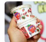
Ice Cream Rumpit Laut Rp. 5.000 /cup