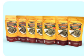
PINDANG TERI CRISPY Rp20.000/pcs