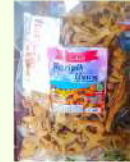
Keripik Usus Rp. 20.000 /pcs