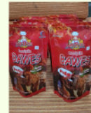
Keripik Bawes Rp. 20.000 /160gr