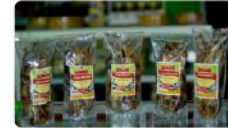
Ikan Asin Bawis Rp. 15.000 /pcs