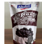
Amplang Batu Bara Rp. 22.000 /160gr