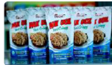
Teri Crispy Rp. 20.000 /pcs