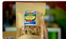
Keripik Kulit Ikan Bandeng Crispy Rp. 18.000 /pcs