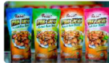
Keripik Ikan Bawis Rp. 20.000 /pcs