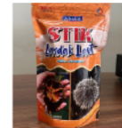
Stik Landak Laut Rp. 17.000 /160gr