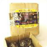
Dodel Coklat Mangrove Rp. 25.000 /box (isi 8 buah)