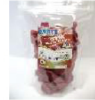
Stick Buah Naga Rp. 10.000 /100gr