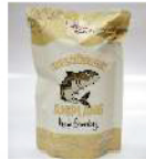
Amplang Bandeng Rp. 20.000 /160gr