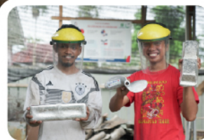
INGOT & BALING-BALING PERAHU Contact Person: Telihan Recycle 0822 5305 0933

Salin Swara atau kepanjangan dari Sampah Keliling Swadaya Masyarakat merupakan program CSR Badak LNG yang memiliki makna yang terselipkan yaitu melalui program ini harapannya dapat mengubah bunyi dan memperkeras gaung bahwa sampah yang semula memiliki konotasi negatif akan selalu mempunyai nilai positif yang dapat memberdayakan masyarakat. Program Salin Swara pada pelaksanaannya telah mengikutsertakan 5 kelompok Bank Sampah untuk sama sama saling melakukan aksi untuk mengentaskan permasalahan di Kota Bontang. Diantaranya yaitu Bank Sampah Ceria, Telihan Recycle, Bank Sampah Selangan Berseri, Bank Sampah Lembah Berseri, Bank Sampah Masdarling, dan Tanjung Mamat Fiberglass.