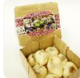
Coklat Caramel Rp. 25.000 /box (isi 8 buah)