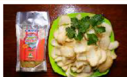
Kerupuk Kepiting Rp. 16.000