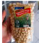
Amplang Pilus Rumput Laut Rp. 10.000 /85gr