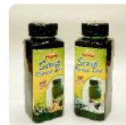
Sirup Rumpit Laut Rp. 25.000 /botol