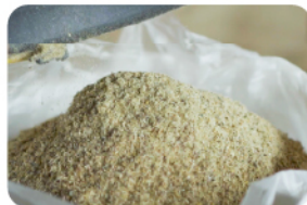
PAKAN TERNAK Rp11.000/kg