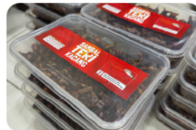
SAMBAL TERI KACANG Rp30.000/pcs