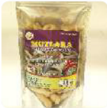
Amplang Mangrove Rp. 20.000 /90gr