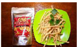
Stick Bonstyk Rp. 18.000

Dikenal dengan kawasan perairan yang luas, Bontang memiliki potensi hewan pesisir yang siap diolah. Tersedia kepiting tambak untuk konsumsi keluarga maupun kebutuhan usaha kuliner.