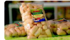
Amplang Ikan Tenggiri Rp. 20.000 /pcs