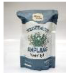
Amplang Rumput Laut Rp. 10.000 /160gr